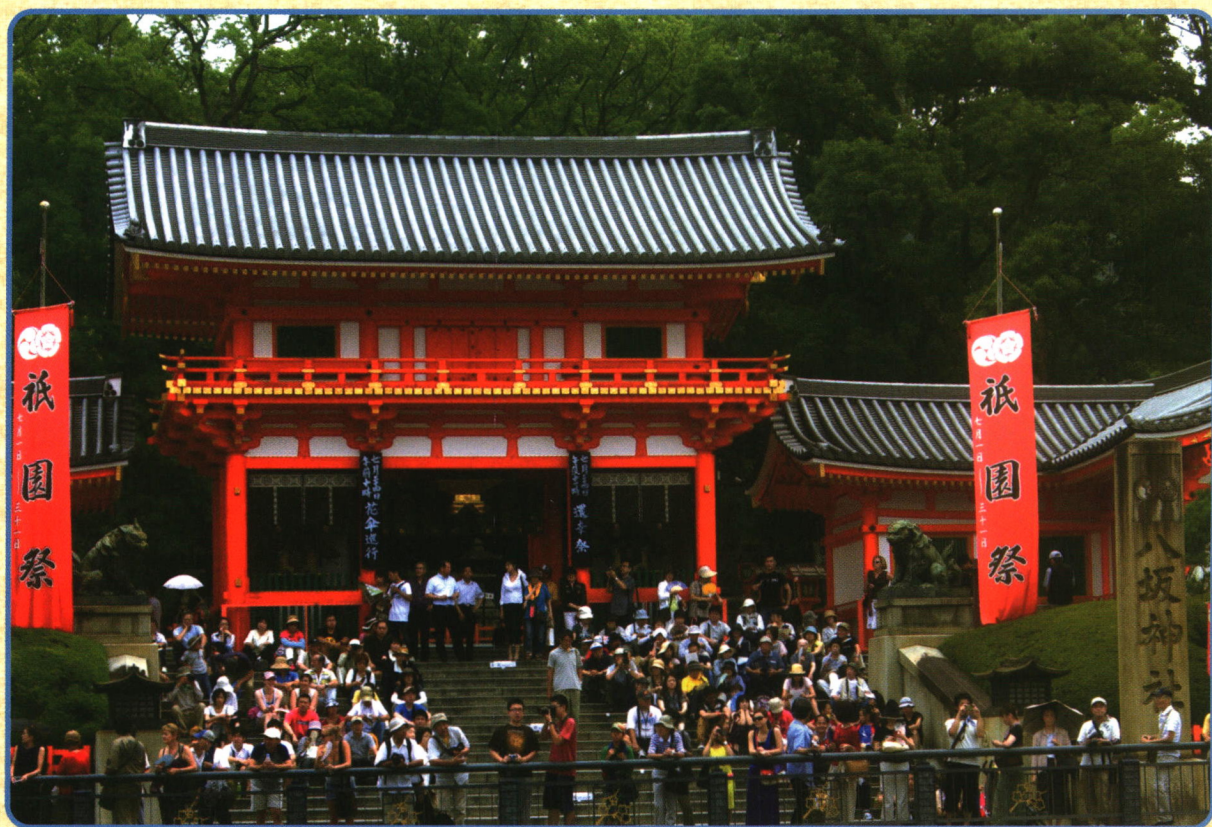
日本京都加茂神社