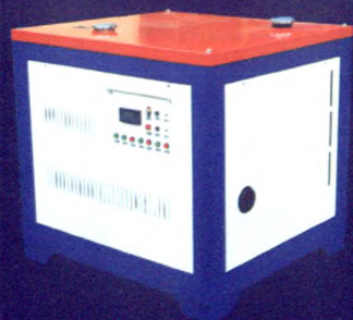
6HYW-180大型车载式烟雾机

南通市广益机电有限公司 Nantong Guangyi Mechanical & Electrical Co., Ltd.