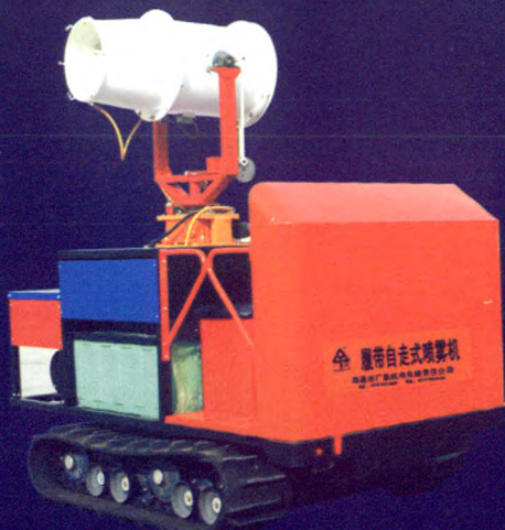
履带自走式高射程喷雾机