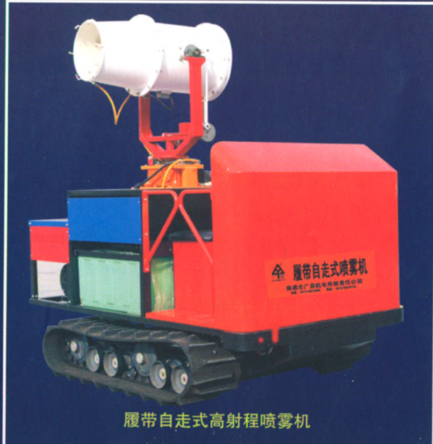
履带自走式高射程喷雾机