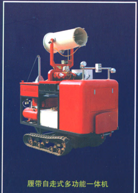
履带自走式多功能一体机