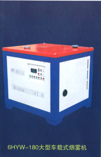
6HYW-180大型车载式烟雾机