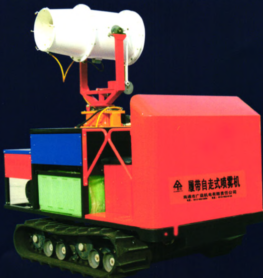
履带自走式高射程喷雾机