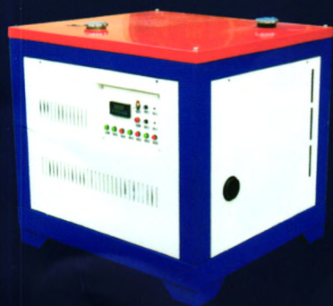
6HYW-180大型车载式烟雾机