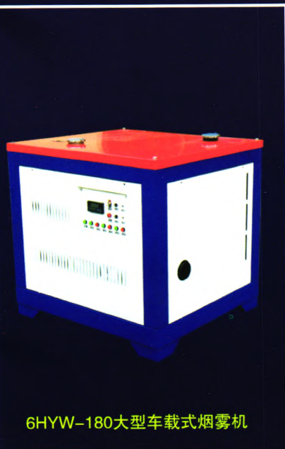
6HYW-180大型车载式烟雾机