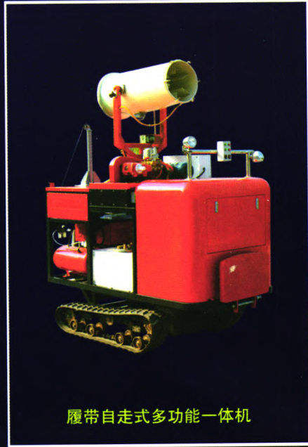
履带自走式多功能一体机