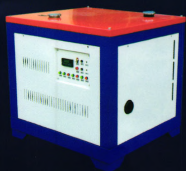
6HYW-180大型车载式烟雾机