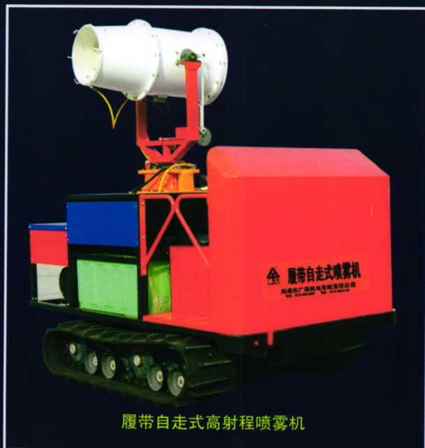
履带自走式高射程喷雾机