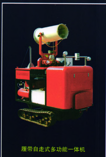
履带自走式多功能一体机