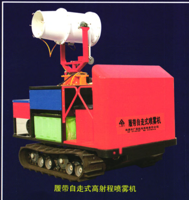
履带自走式高射程喷雾机