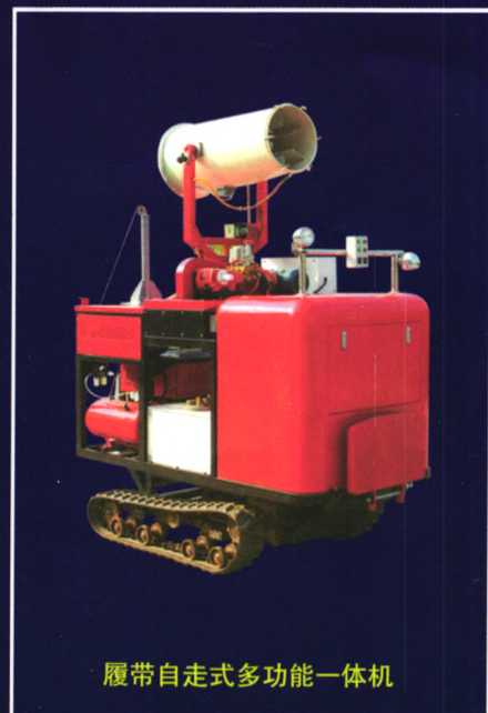
履带自走式多功能一体机