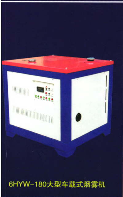
6HYW-180大型车载式烟雾机