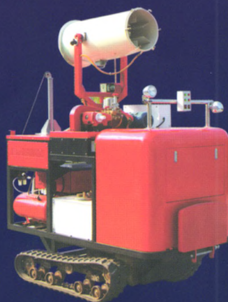
履带自走式多功能一体机