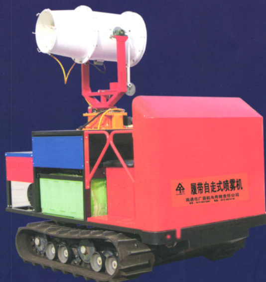
履带自走式高射程喷雾机