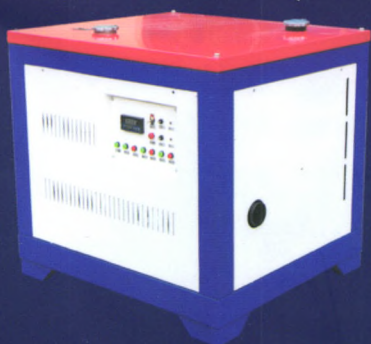
6HYW-180大型车载式烟雾机