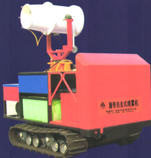
履带自走式高射程喷雾机