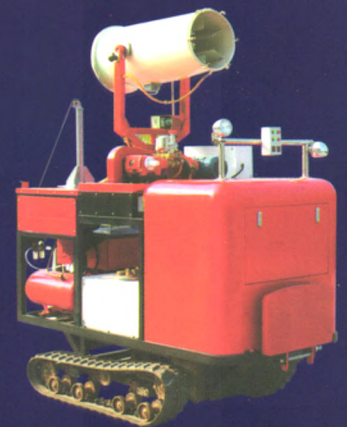
履带自走式多功能一体机