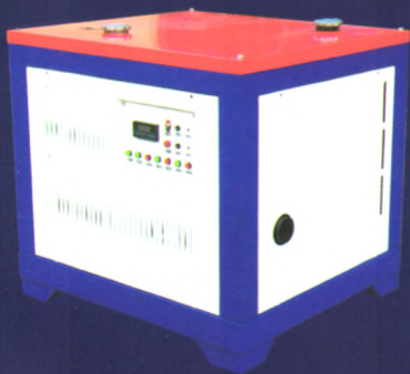
6HYW-180大型车载式烟雾机