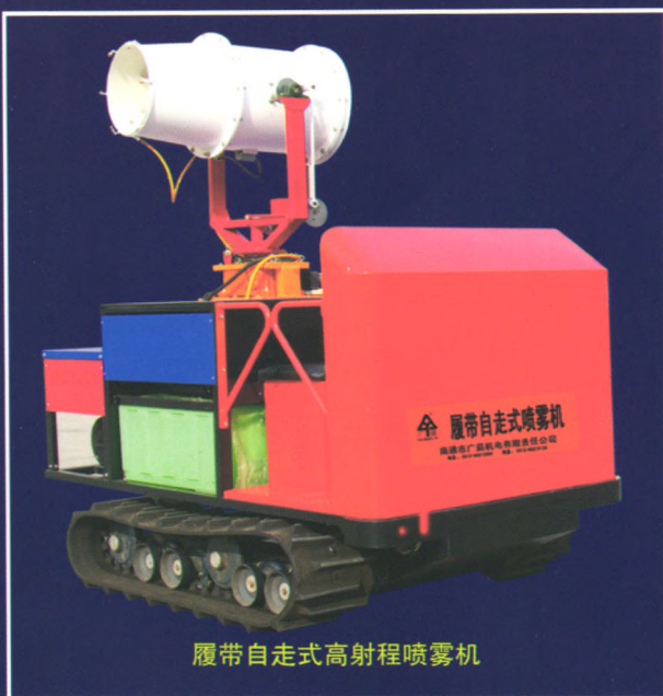
履带自走式高射程喷雾机