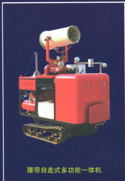
履带自走式多功能一体机