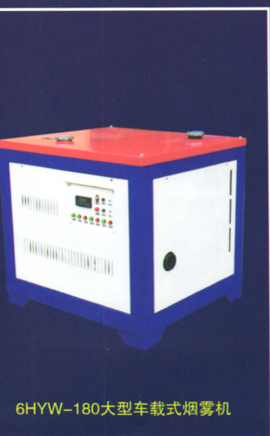
6HYW-180大型车载式烟雾机