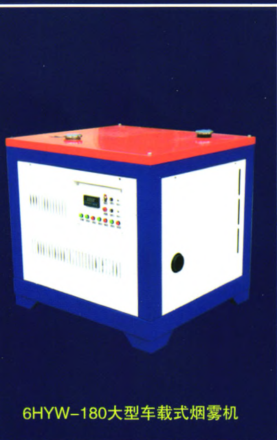
6HYW-180大型车载式烟雾机