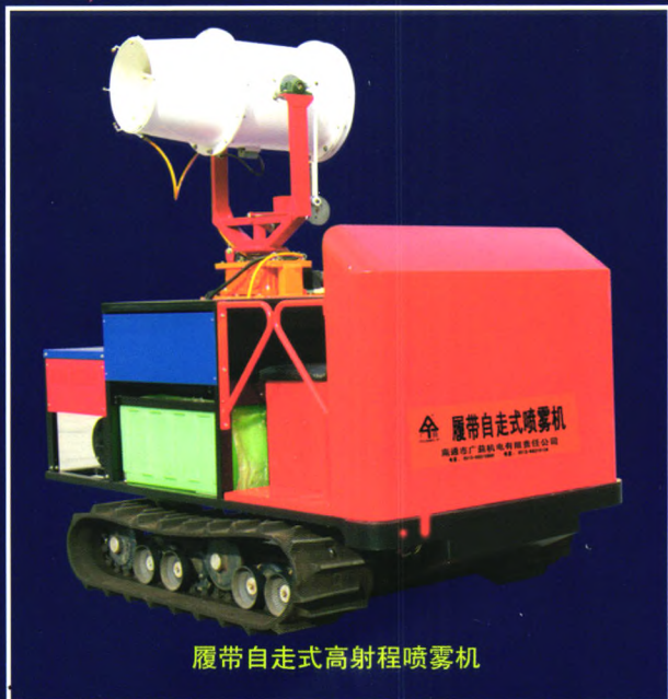
履带自走式高射程喷雾机