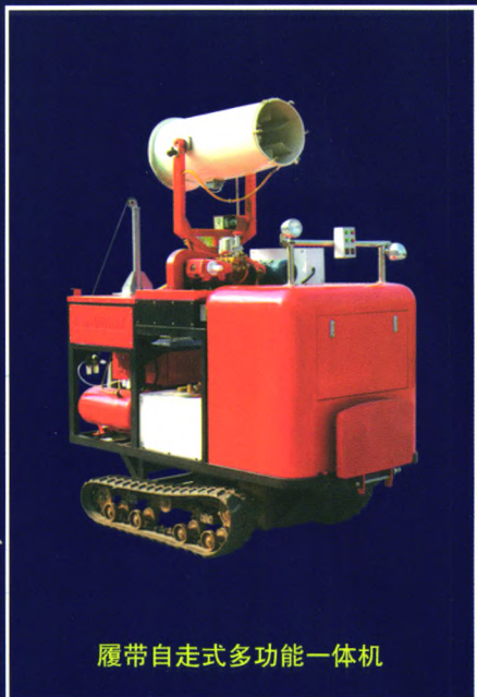
履带自走式多功能一体机