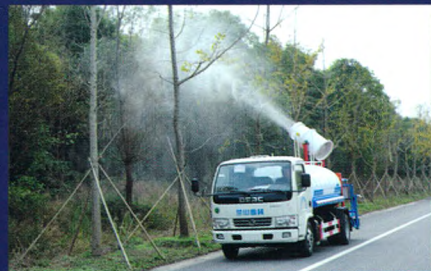
绿化洒水车喷雾效果

底盘可选配东风天锦、庆铃、福田欧马可等车型，罐体容积3-10立方，配套高射程喷雾机喷雾水平射程30-120米，垂直射程20-60米。可进行树木浇灌、农药喷洒、道路洒水、冲洗等作业。