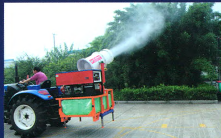
拖拉机悬挂式喷雾机