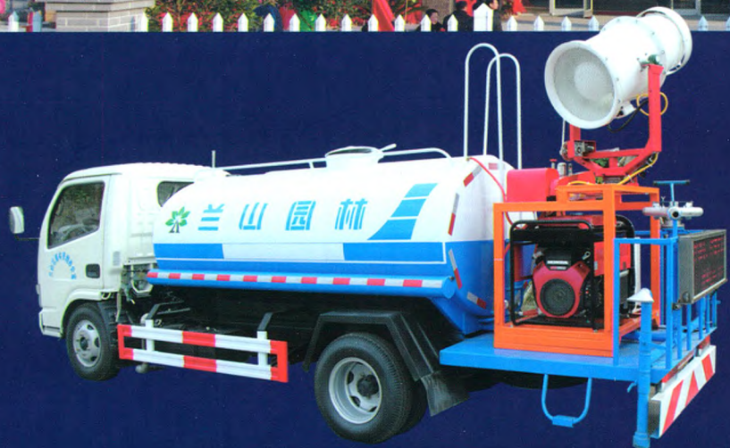
“广益牌”多功能绿化洒水车

底盘可选配东风天锦、庆铃、福田欧马可等车型，罐体容积3-10立方，配套高射程喷雾机喷雾水平射程30-120米，垂直射程20-60米。可进行树木浇灌、农药喷洒、道路洒水、冲洗等作业。