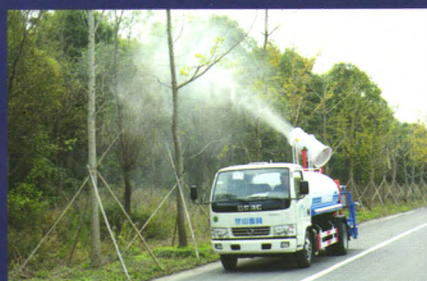
绿化喷洒水车喷雾效果

底盘可选配东风天锦、庆铃、福田欧马可等车型，罐体容积3-10立方，配套高射程喷雾机喷雾水平射程30-120米，垂直射程20-60米。可进行树木浇灌、农药喷洒、道路洒水、冲洗等作业。