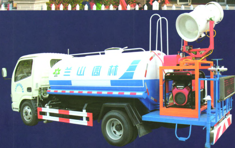
“广益牌”多功能绿化喷洒水车

底盘可选配东风天锦、庆铃、福田欧马可等车型，罐体容积3-10立方，配套高射程喷雾机喷雾水平射程30-120米，垂直射程20-60米。可进行树木浇灌、农药喷洒、道路洒水、冲洗等作业。