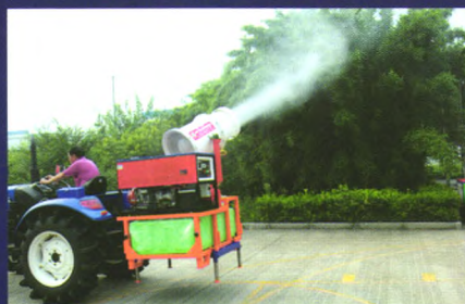
拖拉机悬挂式喷雾机