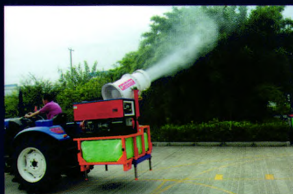
拖拉机悬挂式喷雾机