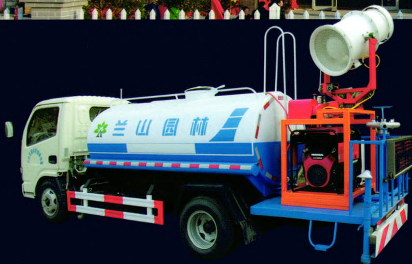
“广益牌”多功能绿化洒水车

底盘可选配东风天锦、庆铃、福田欧马可等车型，罐体容积3-10立方，配套高射程喷雾机喷雾水平射程30-120米，垂直射程20-60米。可进行树木浇灌、农药喷洒、道路洒水、冲洗等作业。