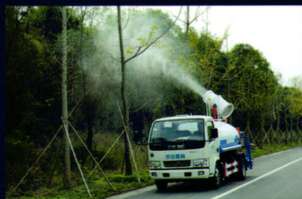
绿化洒水车喷雾效果

底盘可选配东风天锦、庆铃、福田欧马可等车型，罐体容积3-10立方，配套高射程喷雾机喷雾水平射程30-120米，垂直射程20-60米。可进行树木浇灌、农药喷洒、道路洒水、冲洗等作业。