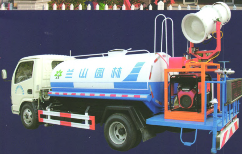
“广益牌”多功能绿化喷洒车

底盘可选配东风天锦、庆铃、福田欧马可等车型，罐体容积3-10立方，配套高射程喷雾机喷雾水平射程30-120米，垂直射程20-60米。可进行树木浇灌、农药喷洒、道路洒水、冲洗等作业。