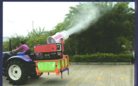
拖拉机悬挂式喷雾机