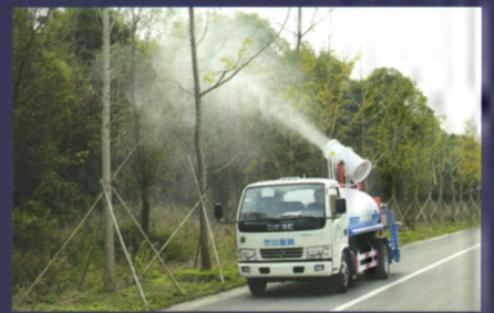
绿化喷洒车喷雾效果

底盘可选配东风天锦、庆铃、福田欧马可等车型，罐体容积3-10立方，配套高射程喷雾机喷雾水平射程30-120米，垂直射程20-60米。可进行树木浇灌、农药喷洒、道路洒水、冲洗等作业。