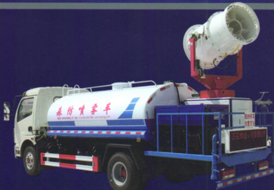
东风多利卡底盘(配套6HW-80C喷雾机组)