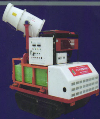
履带自走式高射喷雾机 (50I)