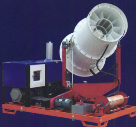
6HW-100高射程喷雾喷烟机