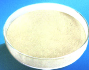
NP-2002/2009喷雾干燥猪血浆蛋白粉

全新生产工艺 蛋白含量高、营养全面、消化率高 促进生长、适口性好、强诱食性 富含免疫物质、增强抵抗力 生物安全性高