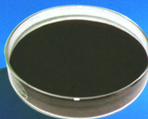
NP-90喷雾干燥猪血红蛋白粉

全新生产工艺 蛋白含量高、营养全面、消化率高 促进生长、适口性好、强诱食性 富含免疫物质、增强抵抗力 生物安全性高