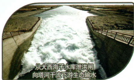
从大西海子水库泄洪闸 向塔河干流下游生态输水

多年以来，在自治区党委、政府的正确领导下，塔管局高度重视党建、党风廉政建设、精神文明建设和综治维稳等各项工作。同时，大力弘扬“和谐、求实、创新、奋进”的塔河精神和“做事讲认真、工作讲效率、言行讲修养、管理讲规范、业绩讲卓越”的塔管局局风，努力推进流域水利事业繁荣和谐发展。