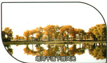
塔河干流下游风光