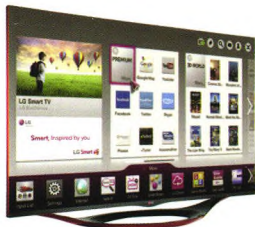
LG 55LA6800-CA， 为中国市场特意打造