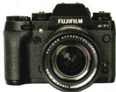
Fujifilm X-T1， 无反相机新旗舰