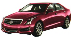
凯迪拉克ATS， 科技达人最中意座驾