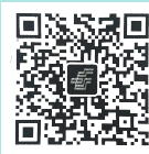
全国邮政报刊 收订微信二维码