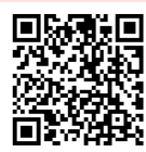
少男少女 订阅链接