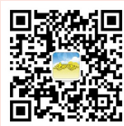
少男少女微信公众号 扫描二维码