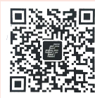
全国邮政报刊 收订微信二维码