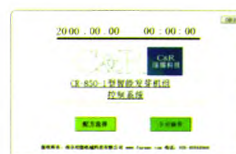
软件著作权: 软著登字第0455593号