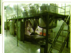
全谷物芽类食品生产线 专利号: ZL201220215370. 3