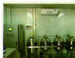
智能化发芽实验室设备 专利号: ZL201120105879. 8