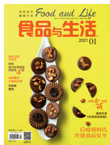
封面静物·夏威夷果脆配可甜心 (唐凤)