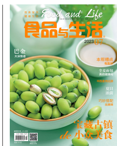
封面静物 · 莲子