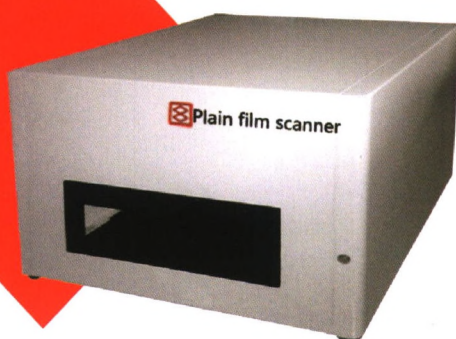
自动高速平片扫描仪