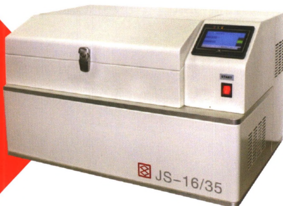
JS系列数字缩微记录仪