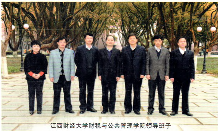
江西财经大学财税与公共管理学院领导班子

人才招聘网址： http://ggxy.jxufe.cn/html/xzgz/xztg/20140117/807.html