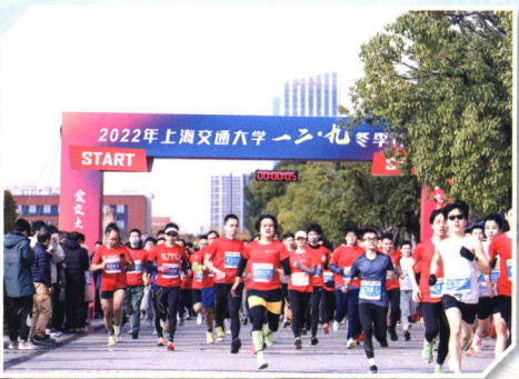
▲举办2022年“一三·九”冬季长跑活动

加强理想信念教育，引导青年学子同心向党。 学校高度重视学生党员发展工作，已设立10个青年马克思主义学校院系分校，规范院校两级党校教育培训管理。学生党建工作取得显著成绩，化学化工学院本科生党支部和药学院本科生党支部先后获评“全国党建工作标杆院系”，国际与公共事务学院博士生第二党支部获评全国高校“百个研究生样板党支部”，机械与动力工程学院党嘉强获评全国高校“百名研究生党员标兵”。