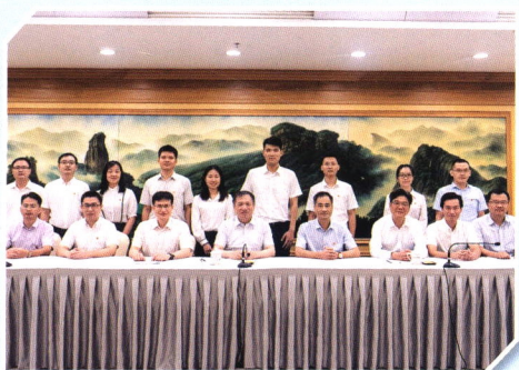
▲校领导带队赴福建看望选调生校友