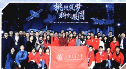
▲学校五次问鼎“挑战杯”并创赛事历史上首个“四连冠”

大力推动就业引导，激励毕业生与国同行。 制定了《关于进一步加强就业引导工作的指导意见》，明确提出构建“招生—培养—就业—校友”全链条育人体系。连续四年召开全校就业引导工作会议，凝聚合力构建就业长效机制。依据学院学科特点和专业特色，梳理形成校院两级“就业引导目录”，构建重点单位核心圈。设立优秀博士毕业生发展奖学金，博士生高水平学术就业率稳步提升。2021年重点行业单位就业引导率首次超过70%，赴国防科技单位和部队、中西部和东北地区、选调生毕业生人数创历史新高。