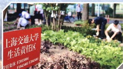
▲班级认领生活责任区开展绿化改造