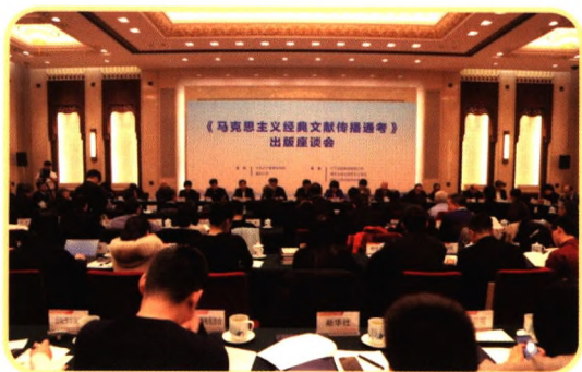
《马克思主义经典文献传播通考》出版座谈会