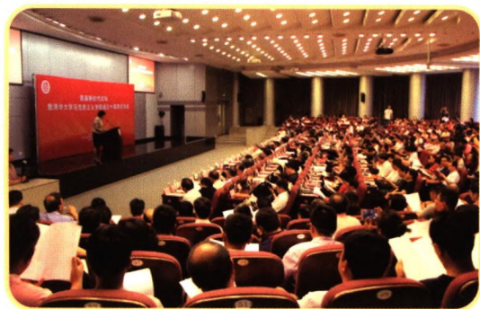
马克思主义学院成立十周年纪念大会