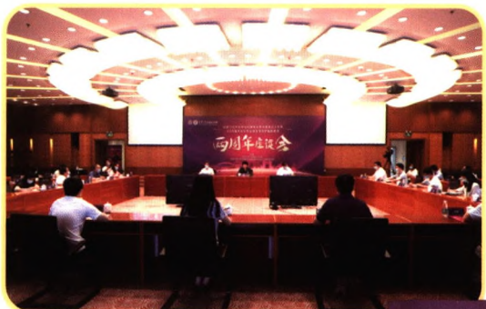
纪念习近平总书记对清华大学马克思主义学院2018届研究生毕业班全体同学勉励寄语两周年座谈会

清华大学马克思主义学院是首批“全国重点马克思主义学院”、首批“国家级教学团队”。在全国学科评估中，马克思主义理论学科为A+，并被列入国家“双一流”学科建设。