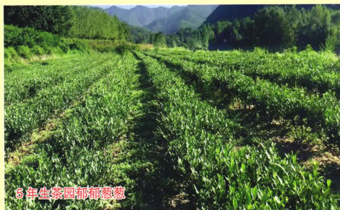
5年生茶园郁郁葱葱