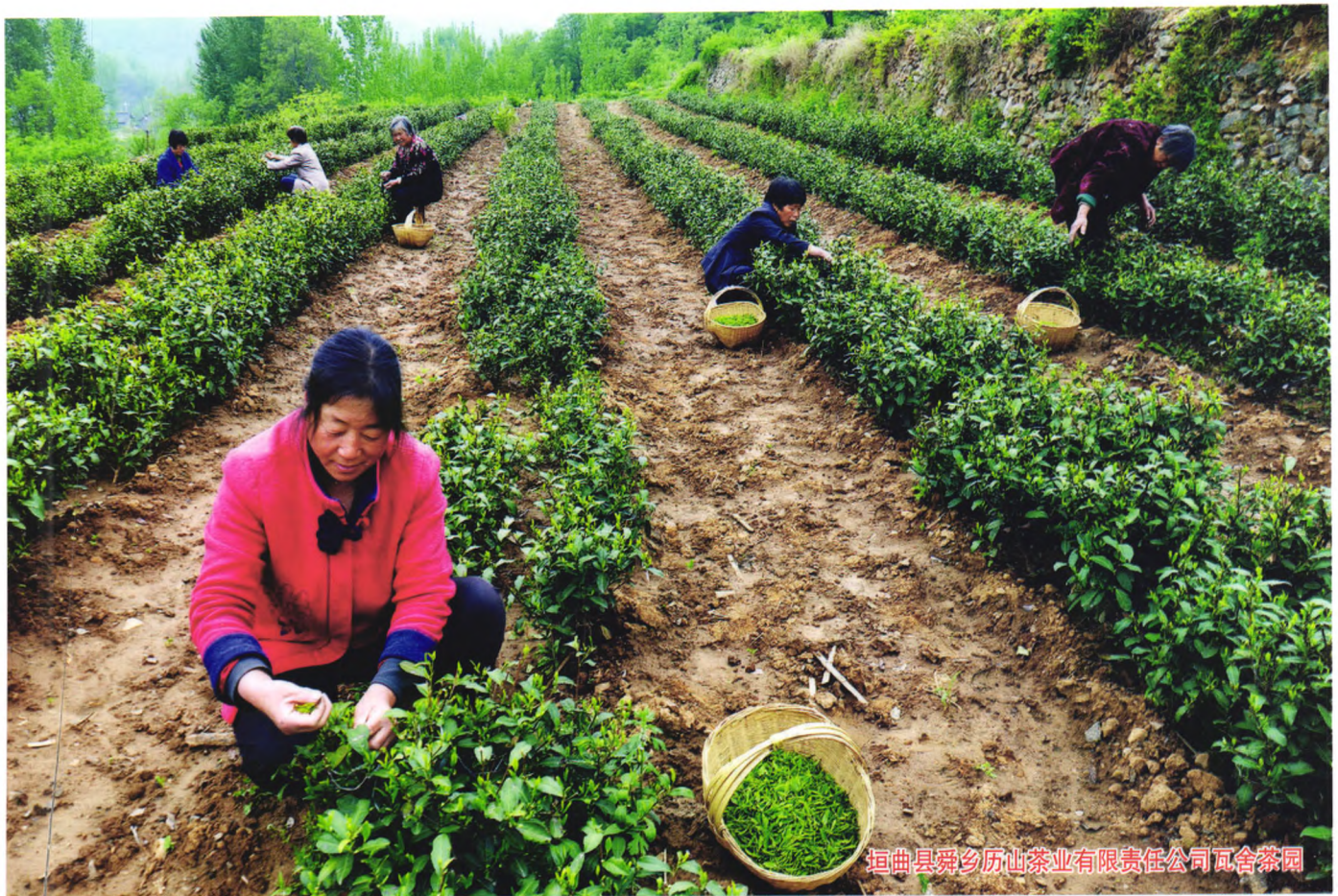
垣曲县舜乡历山茶业有限公司瓦舍茶园