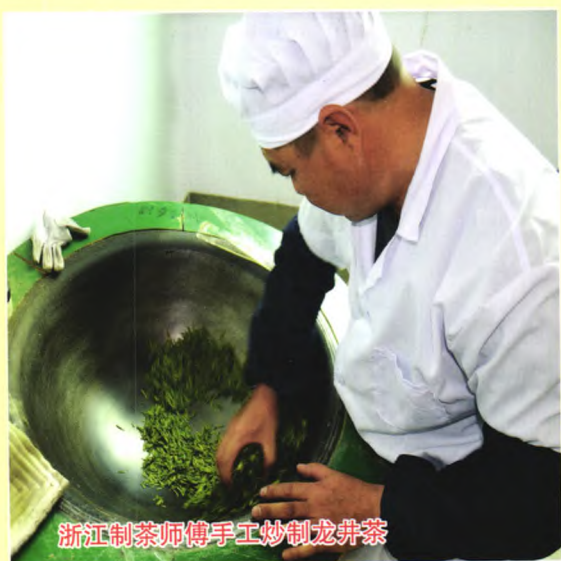
浙江制茶师傅手工炒制龙井茶