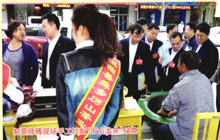
制茶师傅现场手工炒制“历山龙井”绿茶