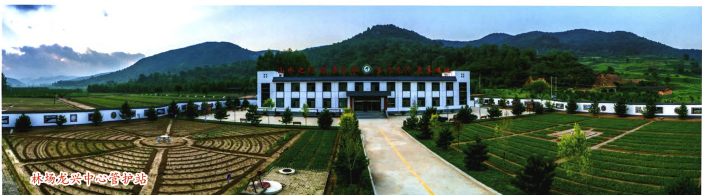
林场龙兴中心管护站