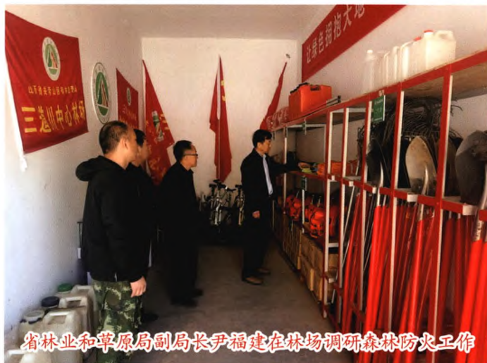
省林业和草原局副局长尹福建在林场调研森林防火工作