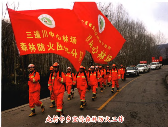
走村串乡宣传森林防火工作