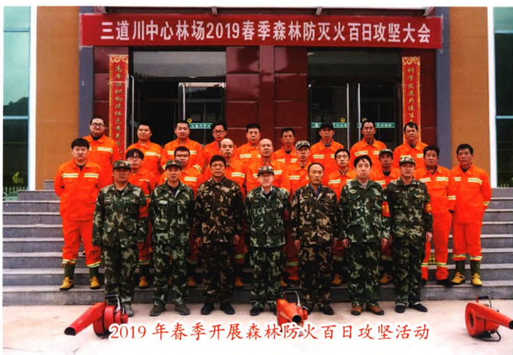
2019年春季开展森林防火百日攻坚活动