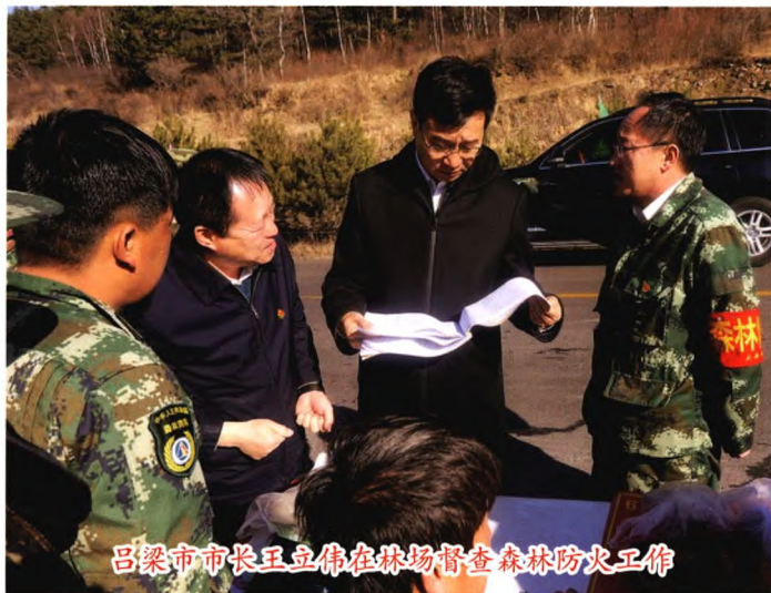
吕梁市市长王立伟在林场督查森林防火工作