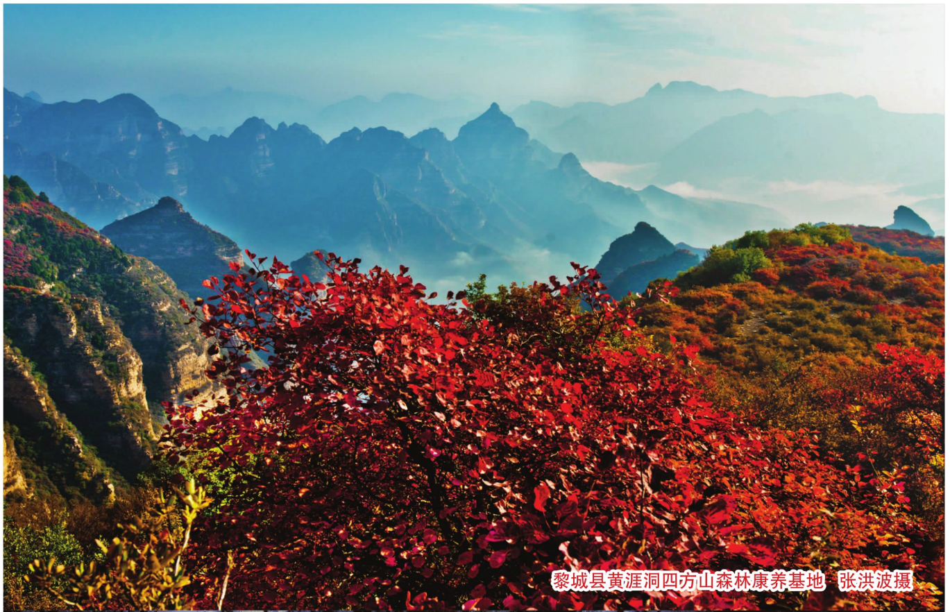
黎城县黄涯洞四方山森林康养基地