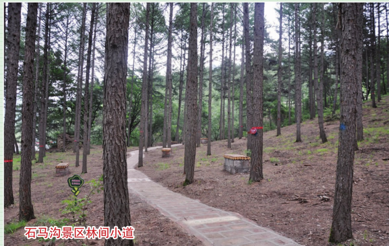
石马沟景区林间小道