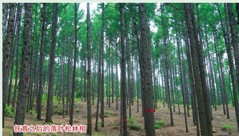
抚育之后的落叶松林相