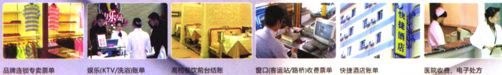
品牌连锁专卖票单 娱乐(KTV/洗浴)账单 高档餐饮前台结账 窗口(客运站/路桥)收费票单 快捷酒店账单 医院收费、电子处方