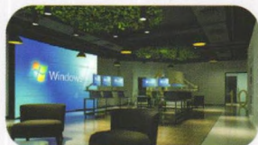
多功能创新体验中心