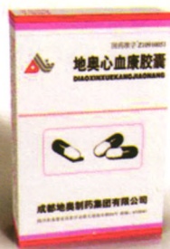
每粒含地奥心血康100mg

[功能主治] 活血化瘀，行气止痛，扩张冠脉血管，改善心肌缺血。用于预防和治疗冠心病，心绞痛以及瘀血内阻之胸痹、眩晕、气短、心悸、胸闷或痛。