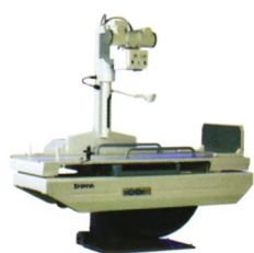
XHX100型X射线诊断机 鲁食药监械（准）字2013第2300542号