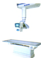
XH-DR2000型数字化医用X射线摄影系统 鲁食药监械（准）字2013第2300182