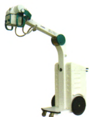
XH-MB6-16型移动式X射线摄影机 鲁食药监械（准）字2013第2300258号