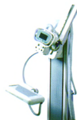
XHX300型数字化医用X射线摄影系统 鲁食药监械（准）字2013第2300543