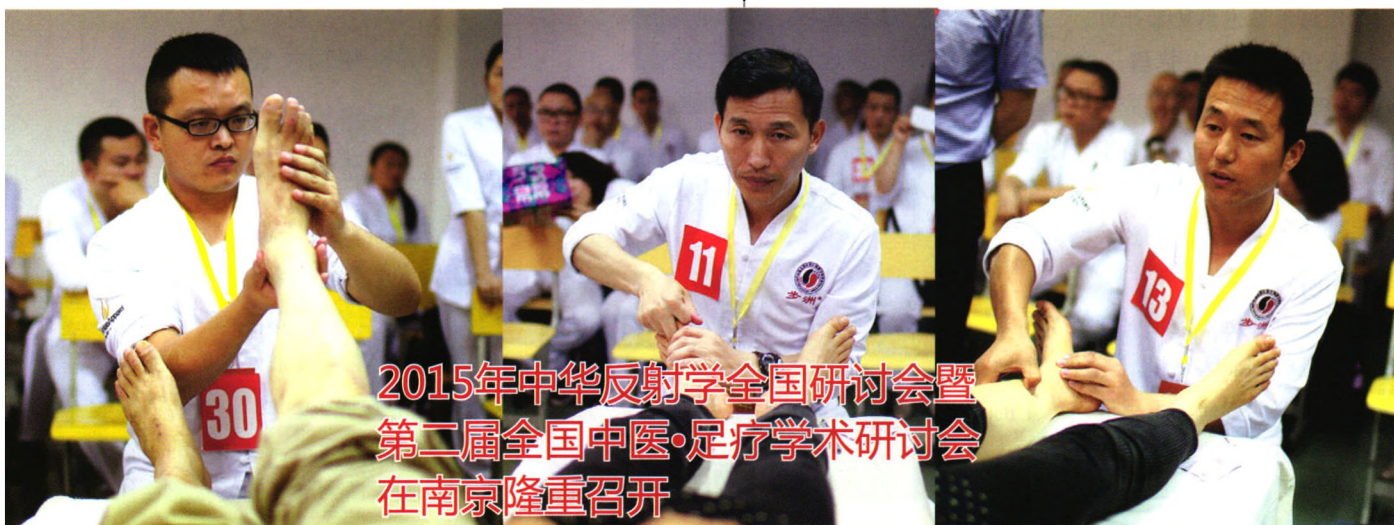
2015年中华反射学全国研讨会暨 第二届全国中医·足疗学术研讨会 在南京隆重召开