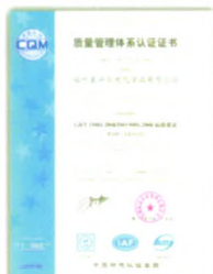
ISO9001:2008质量管理体系认证