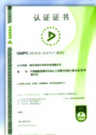
欧洲GMPC体系认证证书