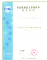
职业健康安全管理体系认证证书