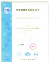
ISO14001:2004环境管理体系认证