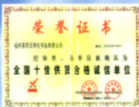
全国十佳供货合格诚信单位证书