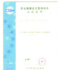
职业健康安全管理体系认证证书