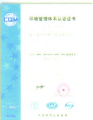
ISO14001:2004环境管理体系认证