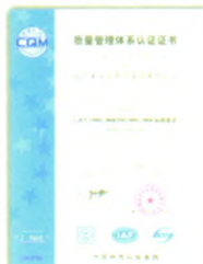
ISO9001:2008质量管理体系认证