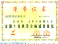
全国十佳供货合格诚信单位证书