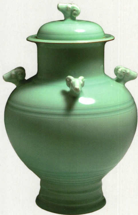
《五羊开泰》 陈烈汉/作