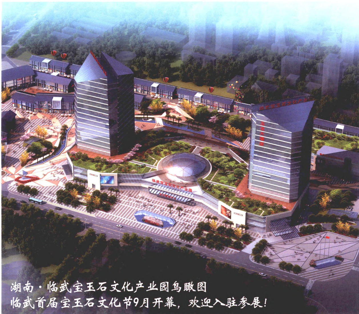
湖南·临武宝玉石文化产业园鸟瞰图 临武首届宝玉石文化节9月开幕，欢迎入驻参展！

指导单位：中国轻工珠宝首饰中心 中国工艺美术学会 | 支持单位：中国科技新闻学会 协办单位：北京五洲天宇认证中心 山西省工艺美术协会