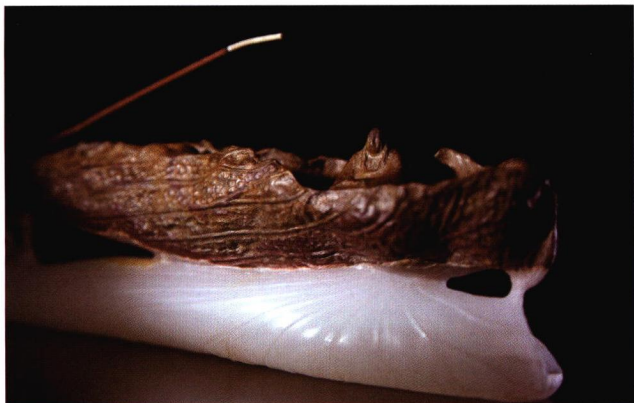
《上善若水 - 静悟》 卓凡艺术工作室 / 作