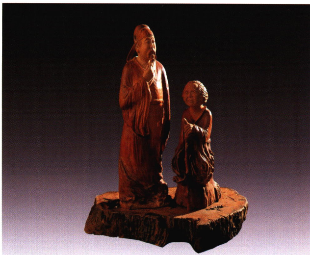
《母子情深——乡愁》 何红 / 作