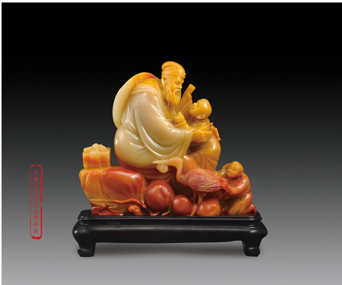
寿山石雕《诗书传家》 陈益晶 / 作