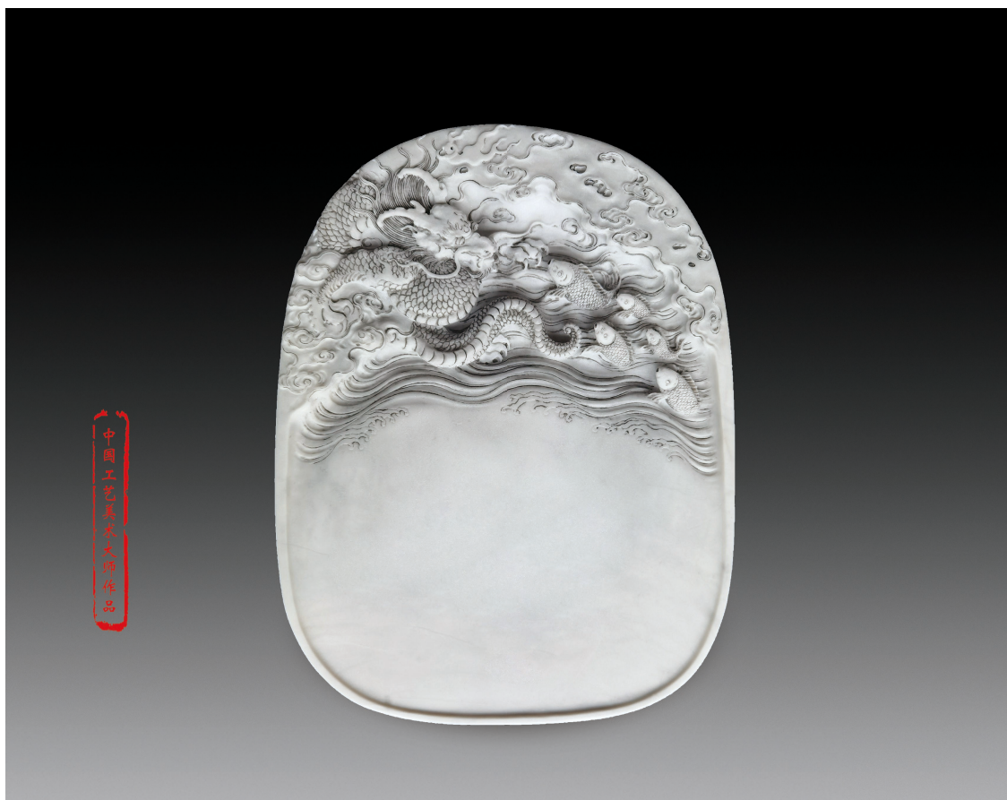
端砚 《鱼跃龙腾》 梁金凌 / 作