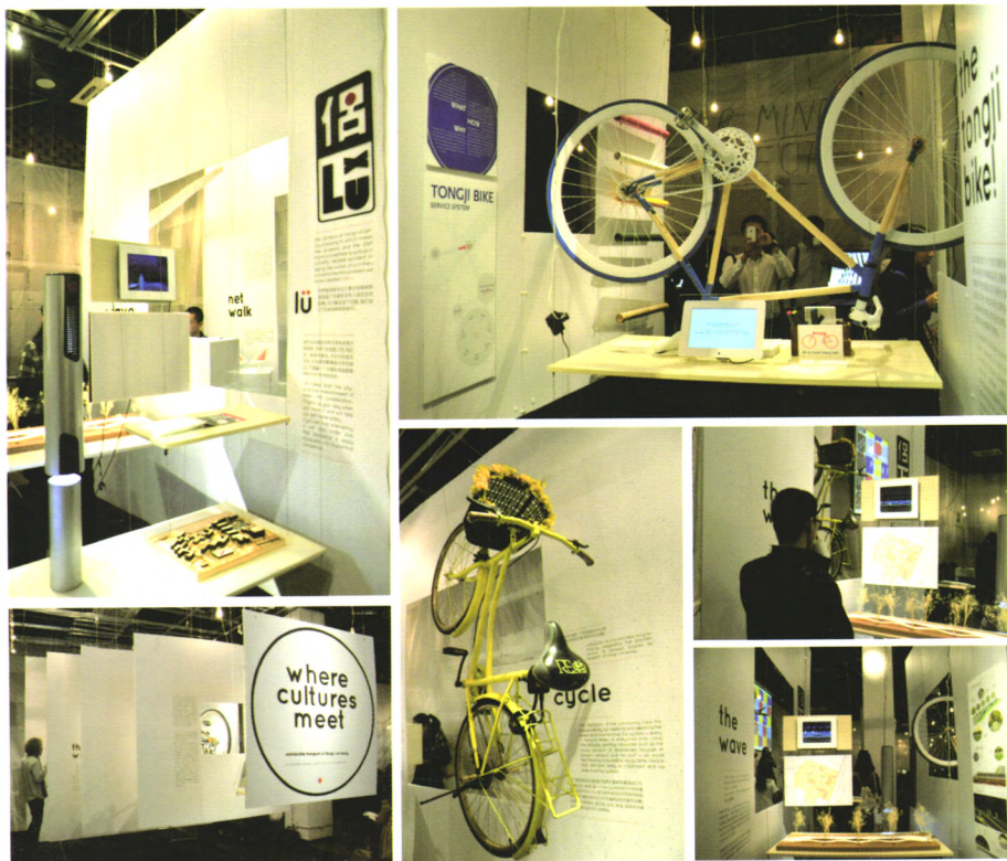
同济设计周——北欧设计周

国际连续出版物号 ISSN 1009-3060 国内统一连续出版物号 CN 31-1777/C