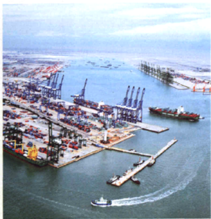
天津港（集团）有限公司协办