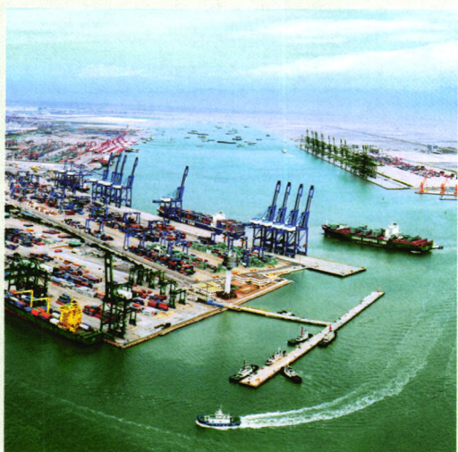
天津港（集团）有限公司协办