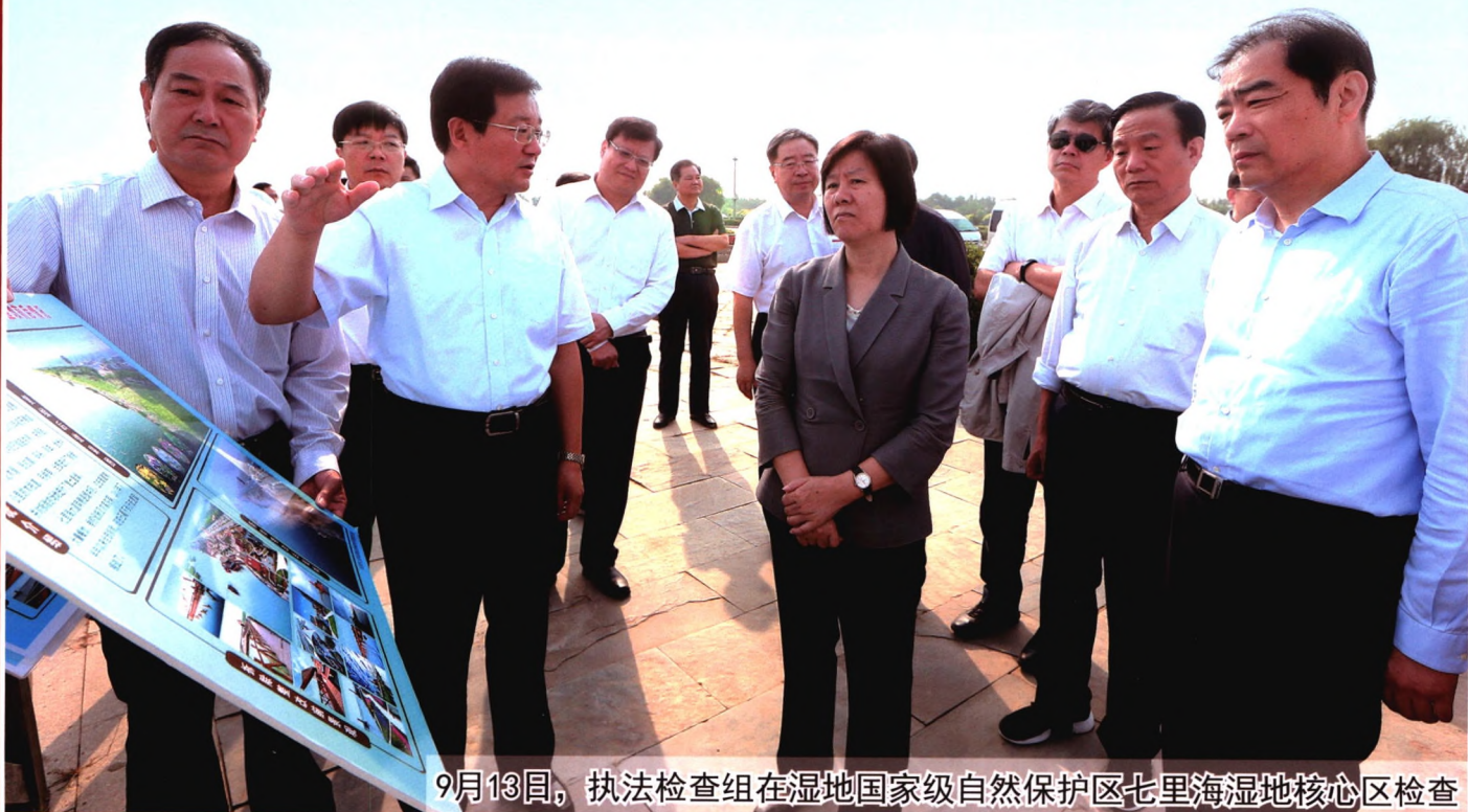
9月13日, 执法检查组在湿地国家级自然保护区七里海湿地核心区检查