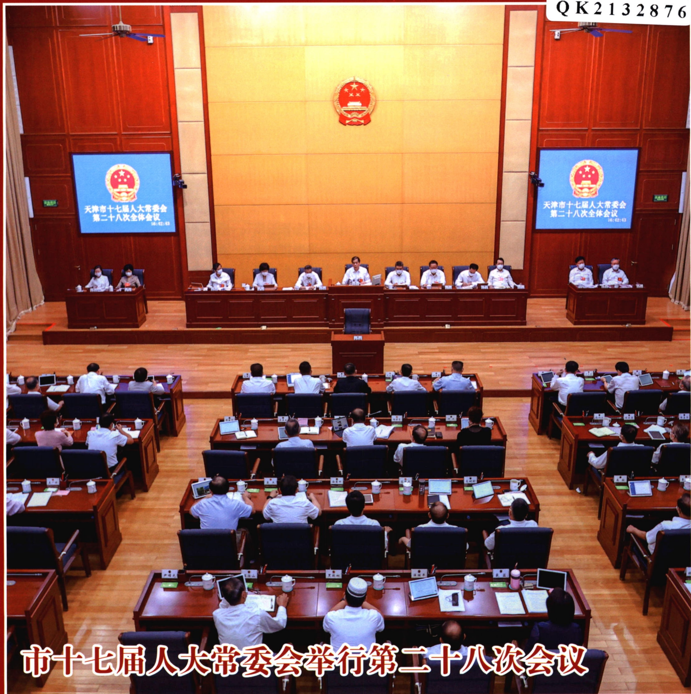
市十七届人大常委会举行第二十八次会议