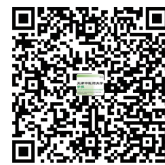
天津中医药大学学报APP